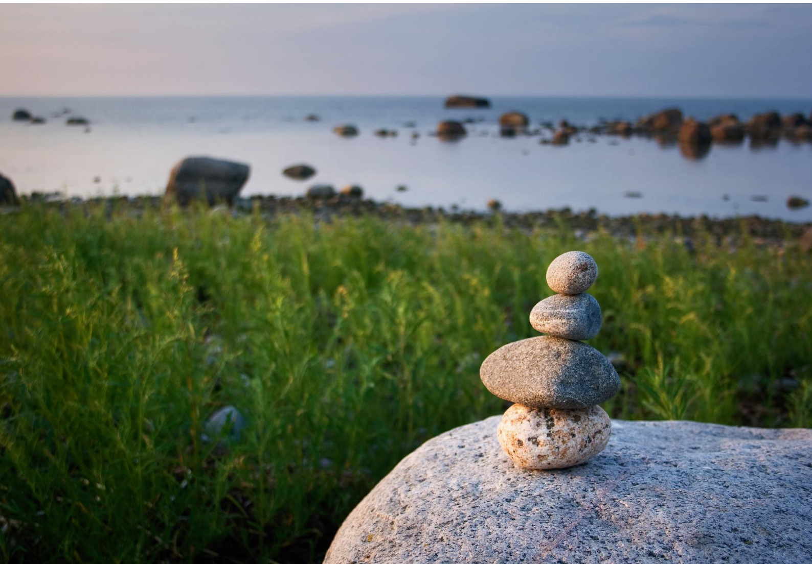
Figur 1