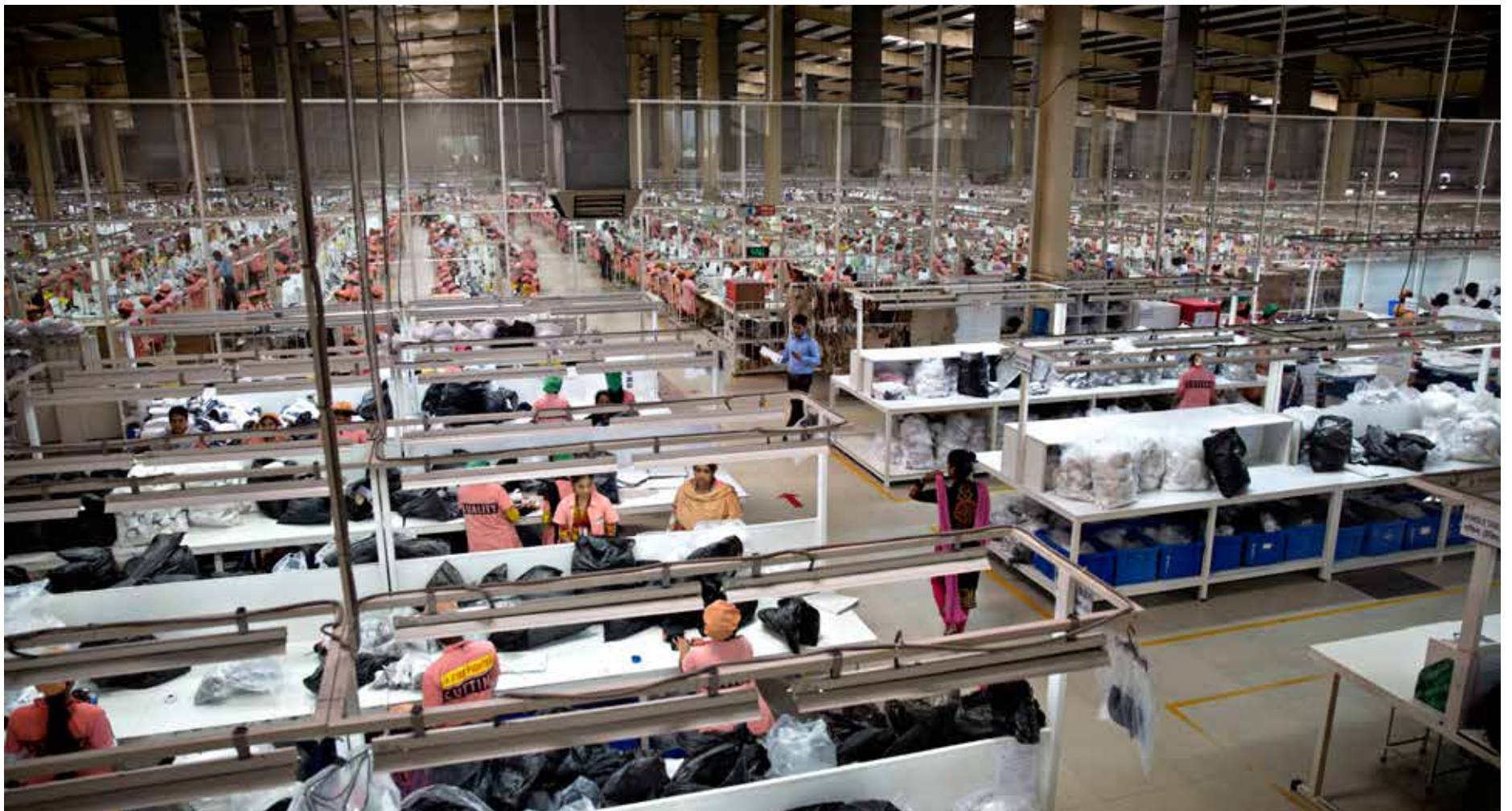
I denne gigantiske fabrikkhallen produserer 4500 arbeidere undertøy for store, vestlige klesmerker som H&M, Cubus og Marks & Spencer. Arbeiderne her har blant bransjens beste arbeidsvilkår. Men selv her tjener syerskene Aftenposten møter ikke mer enn den lovbestemte minstelønnen for maskinsyersker, hvis man ikke regner med overtid.

De bor i enkle skur, jobber 12-timersdager og tjener under 4 kroner timen. Bør vi kjøpe klær laget av kvinner som lever under slike forhold?