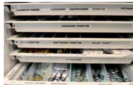
SYSAKER: I Helse Sør-Øst er det på alle måter orden i sysakene. Kirurgiske instrumenter er blant de største risikoproduktene.