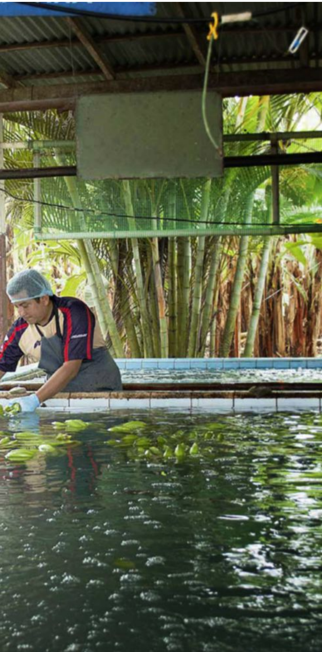
FÅR LØNN: To arbeidere vasker bananer på en fair trade-plantasje i El Guabo i Ecuador.